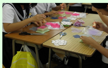
簡単にできる小物づくり