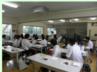
介護される人の 気持ちになってみよう