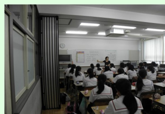
ハンゲルの あいさつを習おう!