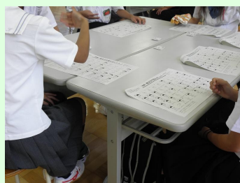
手話を体験してみよう