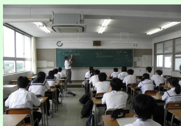
(a+b) 5 の展開公式を作ろう