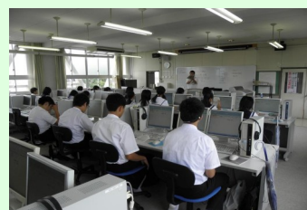
コンピュータ実習 マルチメディアを楽しむ