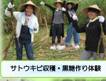
サトウキビ収穫・黒糖作り体験