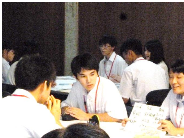
意見交換・交流の様子