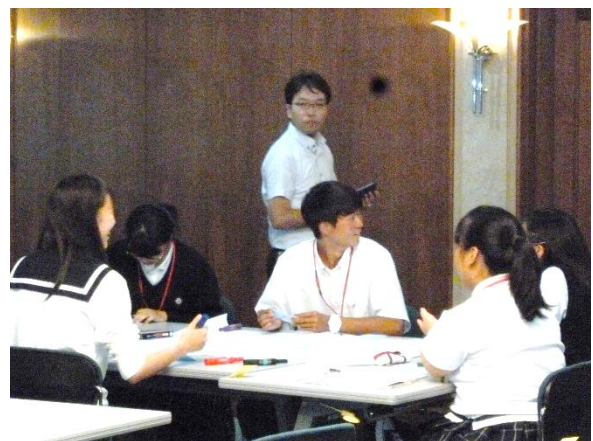
意見交換・交流の様子