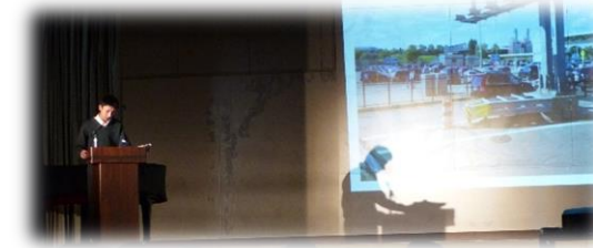
国際理解教育「高校生海外チャレンジ促進事業」 アメリカ短期留学報告