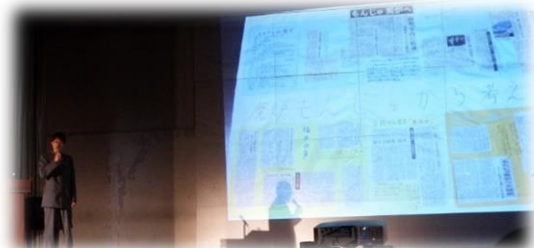
2年「総合的な学習の時間」 新聞切り抜き作品について