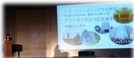
1年「産業社会と人間」 キャンパス巡りについて