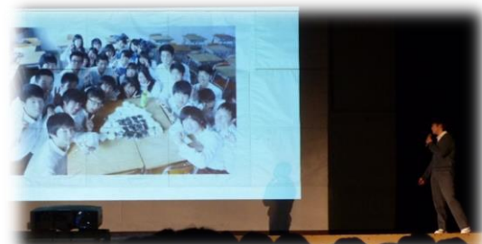
3年「政治・経済」 「おにぎりアクション」について