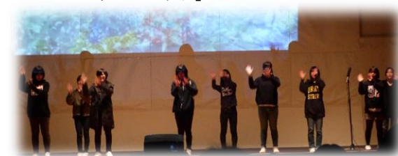
JRC部 「手話パフォーマンス甲子園」に参加して