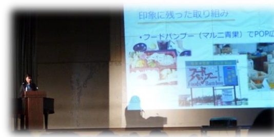
3年 情報活用系列 「情報の表現と管理」における地域連携の実践